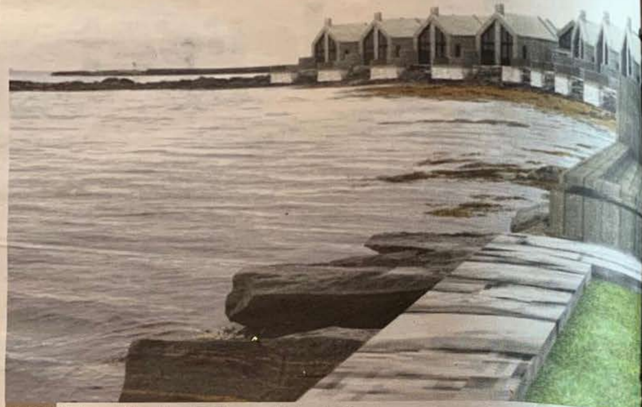
PENT Alle hyttene får unik utsikt til sjøen og tilbod om båtplass. Illustrasjon: Fylling og Bjørge bygg