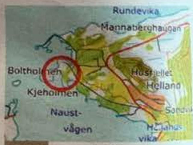
FELT Området for det nye hyttedefeltet ligg innanfor den raude ringen på skissa. Skisse

- Det var hallelujastemning i planutvalet då vi gjekk samrøystes inn for dette. Vi håper vi kan få til fleire slike område, for vi ha mykje kyst å ta av, sa han. Hyttedefeltet ligg ved strandsona i eit maritimt miljø